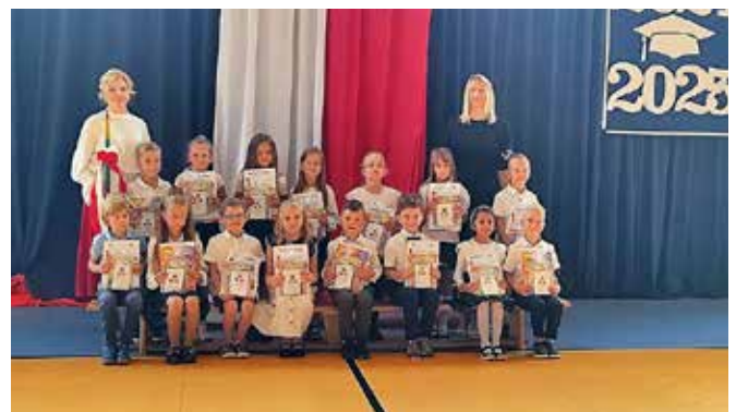
SP Maszewo Duże