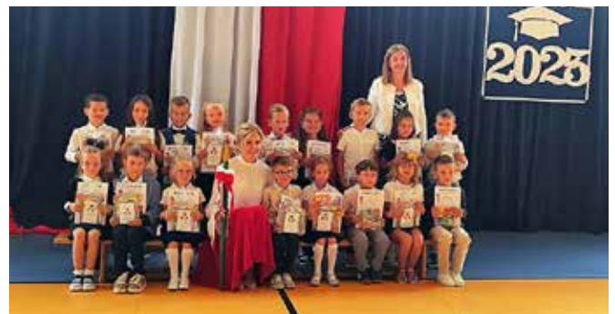
SP Maszewo Duże