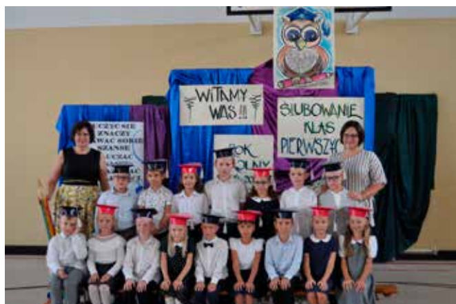
SP Stare Proboszczewice kl. IA