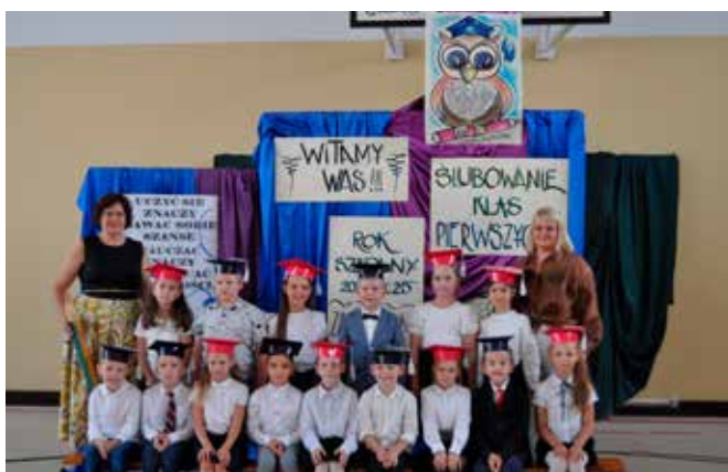
SP Stare Proboszczewice kl. IB