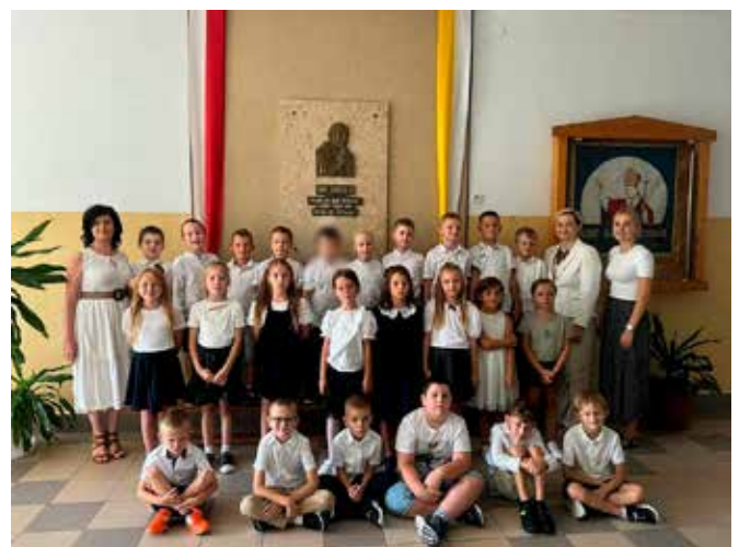
SP Stara Biała