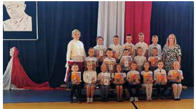
SP Maszewo Duże

Tak więc sumując, do wszystkich placówek oświatowych (szkoły i przedszkola) na terenie naszej gminy uczęszcza 1367 uczniów i przedszkolaków (o 40 więcej niż rok temu).