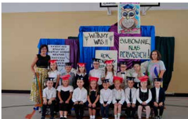
SP Stare Proboszczewice kl. IC