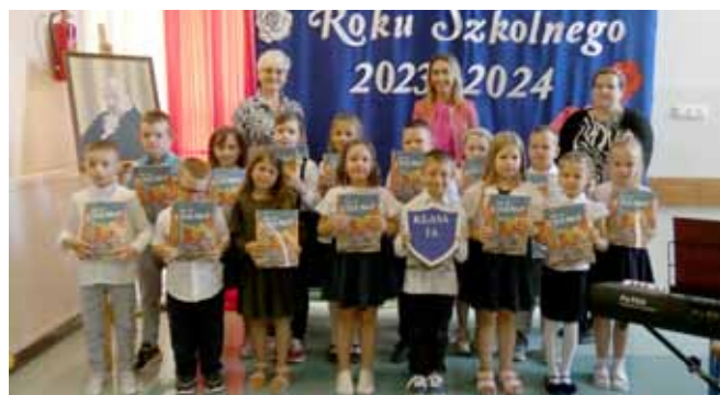
Kl. I A SP w Wyszynie