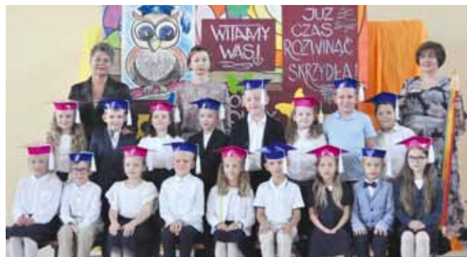
SP w Starych Proboszczewicach