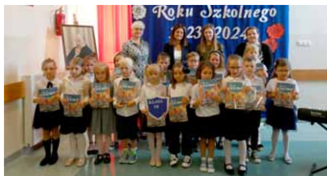
Kl. I B SP w Wyszynie