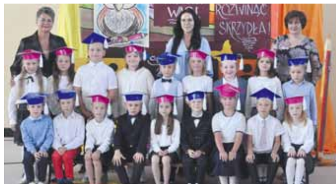
SP w Starych Proboszczewicach