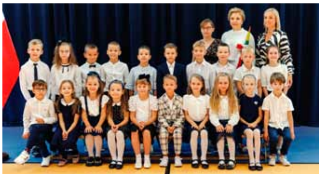
SP w Maszewie Dużym

Proboszczewice – 263 uczniów (w tym 35 pierwszaków) • Przedszkole w Nowych Proboszczewicach – 150 dzieci • SP Stara Biała – 132 uczniów (w tym 11 pierwszaków) oraz 24 dzieci w oddziale przedszkolnym • ZS-P w Wyszynie – 159 uczniów (w tym 31 pierwszaków) oraz 155 przedszkolaków.