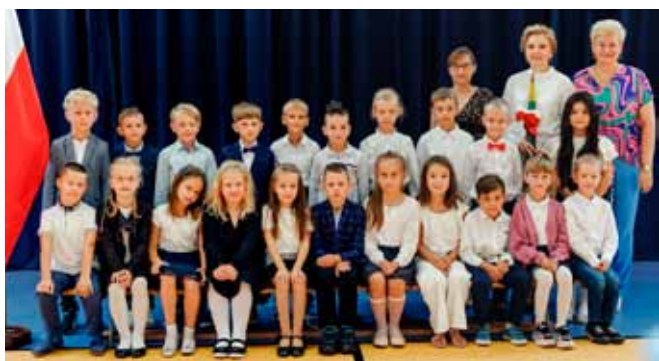
SP w Maszewie Dużym