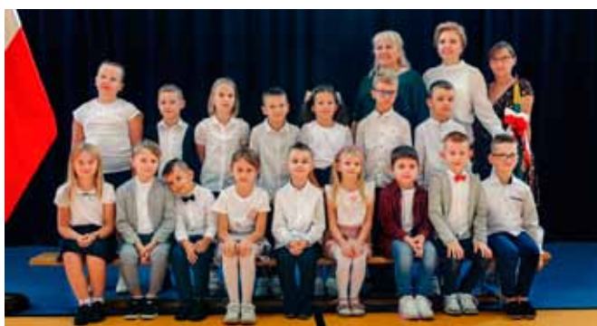
SP w Maszewie Dużym