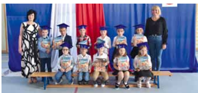
SP w Starej Białej