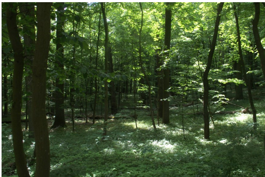
Widok od południowego-wschodu

7. Fotografia z opisem wskazującym orientację w stosunku do sąsiednich terenów lub stron świata albo mapa z zaznaczonym stanowiskiem archeologicznym