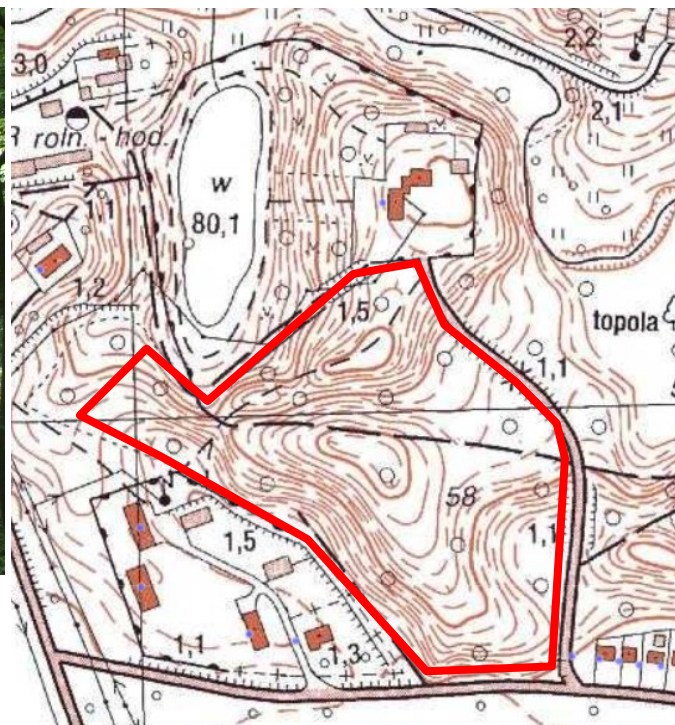
Mapa obrazująca zasięg obiektu