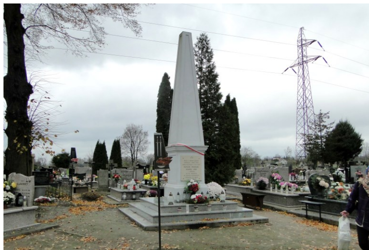
Widok mogiły 1 od południowo-zachodu