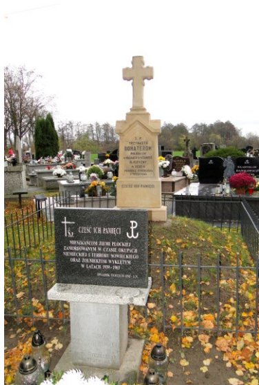
Widok mogiły 2 od południa

7. Fotografia z opisem wskazującym orientację w stosunku do sąsiednich terenów lub stron świata albo mapa z zaznaczonym stanowiskiem archeologicznym