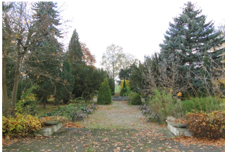
Widok od południowego-wschodu