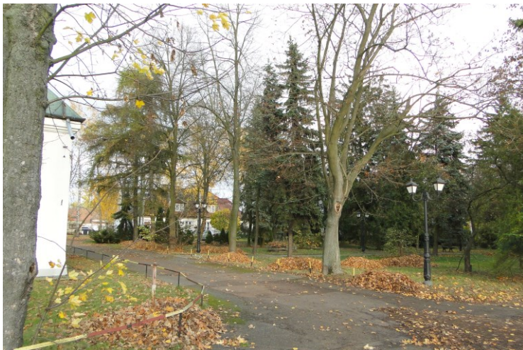
Widok od południowego-zachodu

7. Fotografia z opisem wskazującym orientację w stosunku do sąsiednich terenów lub stron świata albo mapa z zaznaczonym stanowiskiem archeologicznym