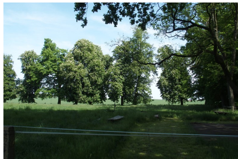
Widok od północnego-wschodu