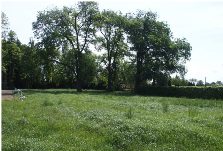
Widok od północnego-zachodu

7. Fotografia z opisem wskazującym orientację w stosunku do sąsiednich terenów lub stron świata albo mapa z zaznaczonym stanowiskiem archeologicznym